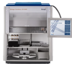
Extrahera LV-200 Extrahera Classic Extrahera HV-5000