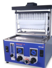
Pressure + 48