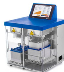
TurboVap 96 Daul